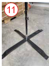
11 coloque el asta de la bandera sobre la plata accesorio para base metálica