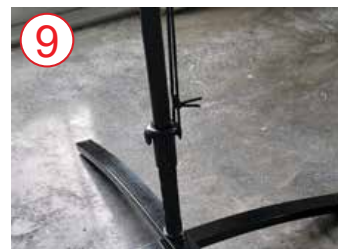
9 conectar cadena elástica desde conector de bandera a mástil