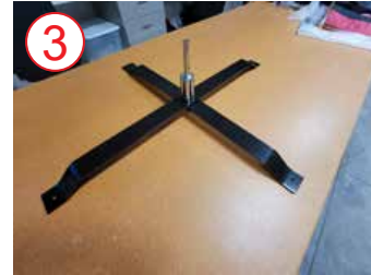
3 sección inferior giratoria de la base metálica