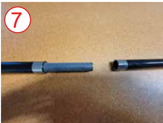
7 conectar postes