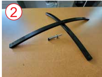
2 cruzar dos patas metálicas con orificio en el centro