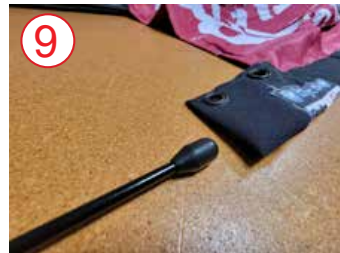
9 inserte el mástil completamente en el bolsillo lateral de la bandera