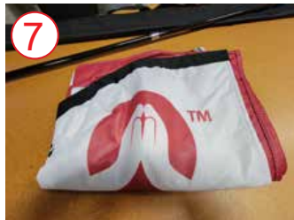
7 bandera totalmente abierta