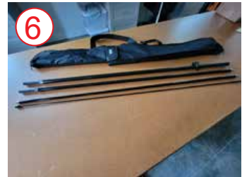
6 quitar los postes de la caja