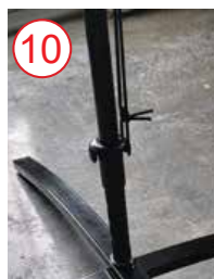
10 conectar cadena elástica desde conector de bandera a mástil