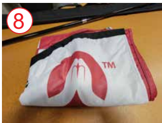
8 bandera totalmente abierta