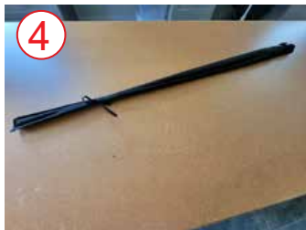
4 caja de poste abierto