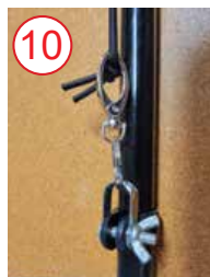
10 conectar cadena elástica desde conector de bandera a mástil