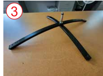
3 atornillar el accesorio de plata en las patas