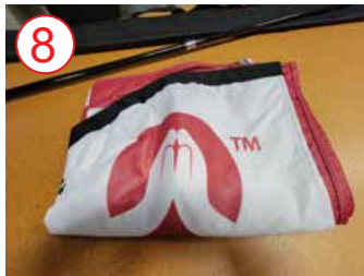
8 bandera totalmente abierta