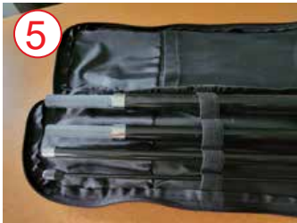
5 lado más pequeño del poste en elástico