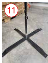
11 coloque el asta de la bandera sobre la plata accesorio para base metálica