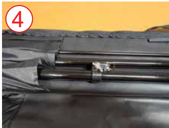
4 estuche de poste abierto (lado más grande en el bolsillo)