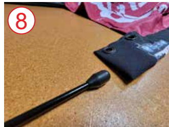
8 inserte el mástil completamente en el bolsillo lateral de la bandera