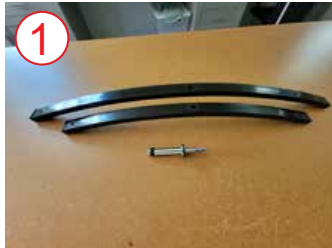
1 Saca patas de metal y accesorio de plata