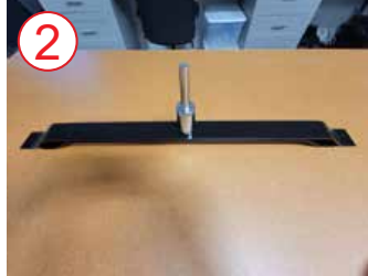
2 tornillo de fijación de plata a base de metal