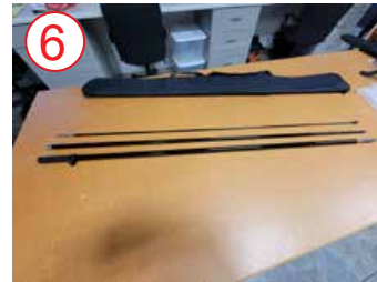
6 quitar los postes de la caja