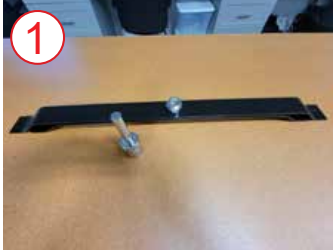
1 Saque la base de metal y el accesorio de plata