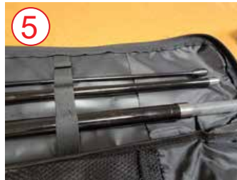
5 lado más pequeño del poste en elástico