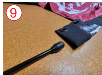
9 inserte el mástil completamente en el bolsillo lateral de la bandera