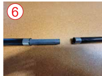
6 conectar postes