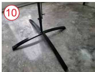
10 coloque el asta de la bandera sobre la plata accesorio para base metálica