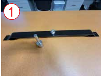
1 Saque la base de metal y el accesorio de plata