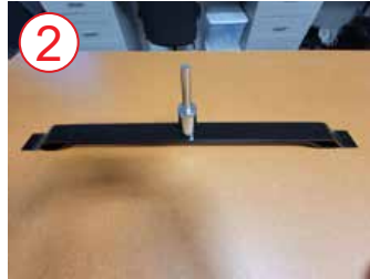
2 tornillo de fijación de plata a base de metal