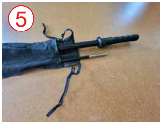
5 quitar los postes de la caja