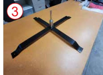
3 sección inferior giratoria de la base metálica