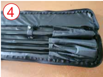
4 estuche de poste abierto (lado más grande en el bolsillo)